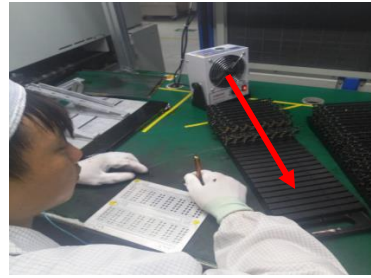
图 2 操作工位离子风机摆放示意

企业现场离子风机摆放工位类似图 2 所示，审核组发现操作工位显然不在离子风机有效空间范围之内。所以该不符合项产生的 直接原因 是企业品质管理人员及现场操作人员对静电防护用具的防护原理解理解不足，静电防护用具使用方式不当导致的，使企业花费相当大的成本却没有达到应有的 ESD 防护效果。