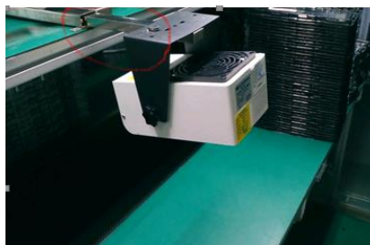
图 3 离子风机伸缩固定器示意

针对该绝缘体管控不足的问题，在审核组提供相关标准与原理知识的基础上，企业提出两个整改方案。整改方案一是将离子风机摆放靠近操作工位一些，缩短距离，角度对正，但审核组提出这无法解决工作台上物料众多，摆放区域有限，以及员工长期正面被离子风机吹导致不适，降低工作效率，偷偷将其转向等根本问题。因此企业创造性地提出整改方案二，充分考虑 ESD 防护用品工作原理和实际生产面临的问题，企业采购了一批伸缩支架，自行设计组装出下图可伸缩式的离子风机，如下左图所示，并将离子风机由工作台一层移至二层，在调节好伸缩距离后、固定起来，精准进行离子耗散，如下右图所示。