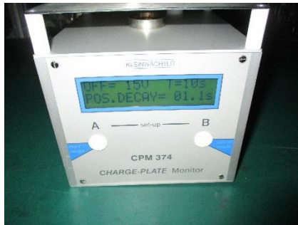
图 5 静电测试数据

整改效果显而易见，首先解决了技术风险，利用表面静电电压仪实测表面电压小于离子风机规格书中标示的平衡电压 \pm 35V ，远低于标准控制 100V 的要求。