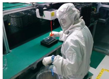
图 4 离子风机精准耗散示意